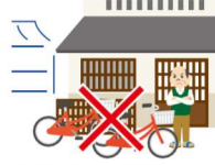
IN FRONT OF OTHER PEOPLE'S HOUSES 他人の家の前

THE BICYCLE RENTAL STORES LISTED HERE (ACCESSIBLE BY QR CODE) ARE ALL CERTIFIED BY KYOTO CITY.